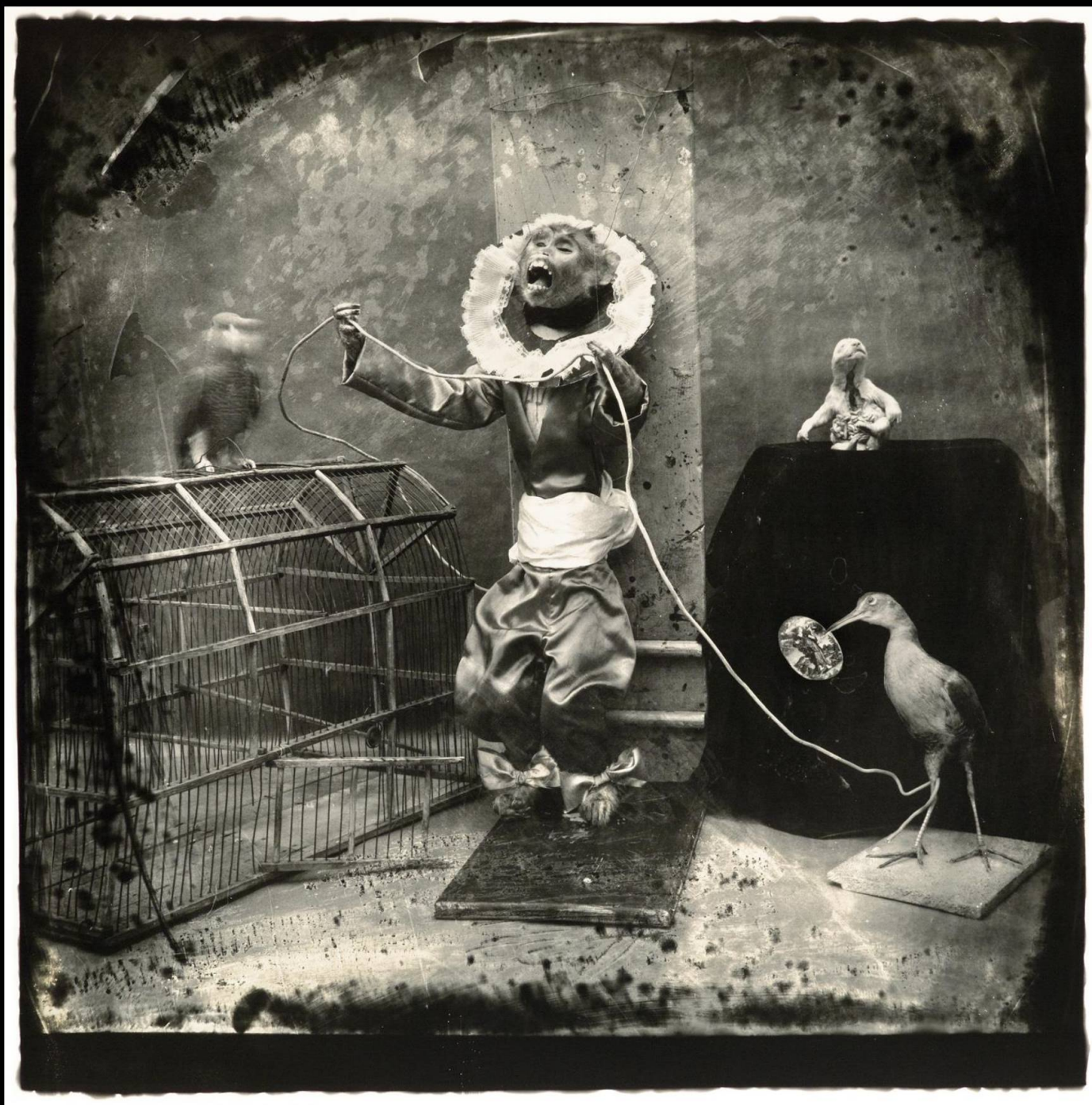
Manuel Osorio, 1982