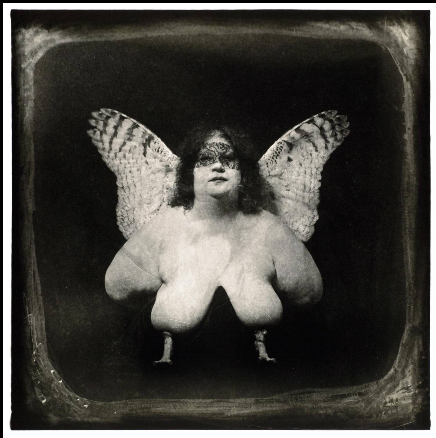
The Bird of Queveda, 1982